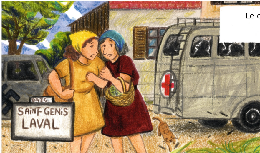
Le convoi se dirige vers Côte-Lorette, un ancien fort militaire sur les hauteurs de la ville.